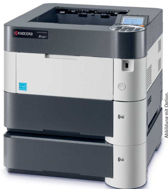
Abbildung mit Option.